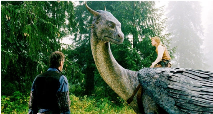
Brom, Saphira y Eragon, en un fotograma de la película que vimos este sábado.